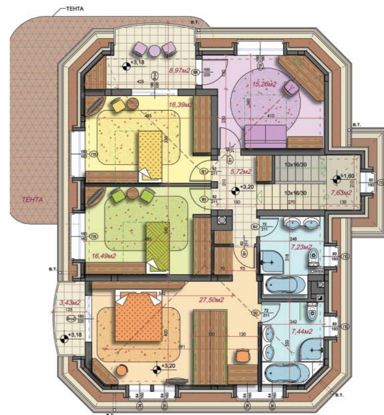
РАЗПРЕДЕЛЕНИЕ НА КОТА +3,20